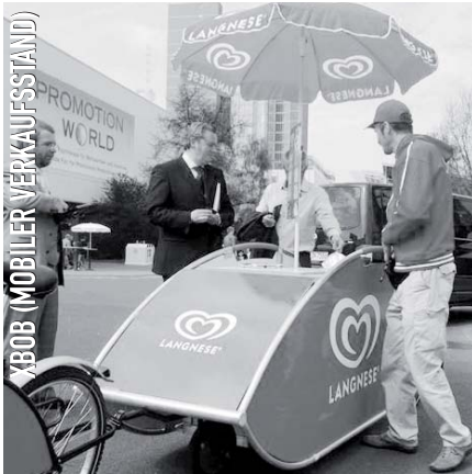
XBOB (MOBILER VERKAUFSSTAND)