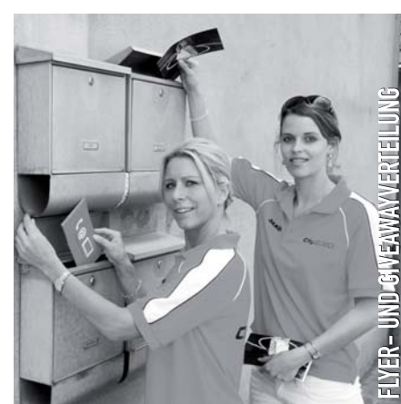
FLYER- UND GIVEAWAYVERTEILUNG